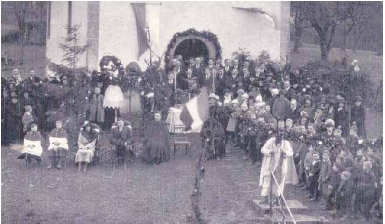
1925 -Baptême d'une cloche de la chapelle, qui s'avérera sonner faux- Le parrain et la marraine sont assis dans des fauteuils à côté d'un des prêtres.