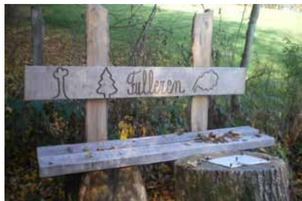
Chemin de Dannemarie, à l'entrée de la forêt en direction de Mertzen