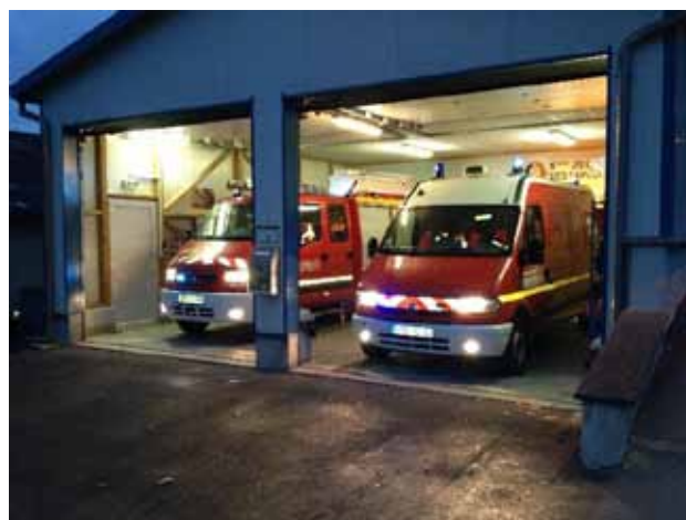
Nos locaux avec nos deux véhicules : le VPI (Véhicule de première intervention) et le VTU (Véhicule Tous Usages).

Chaque lundi soir, nous vérifions notre matériel, maintenons nos acquis en faisant diverses manœuvres ou pratiquons des activités sportives pour nous maintenir en forme.