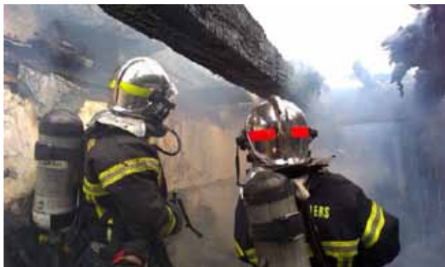
Deux de nos sapeurs-pompiers lors d'une de nos interventions.