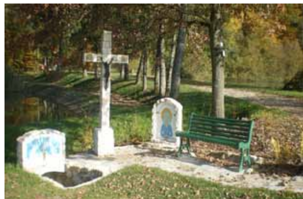
Aménagement au bout de la rue de Hirtzbach