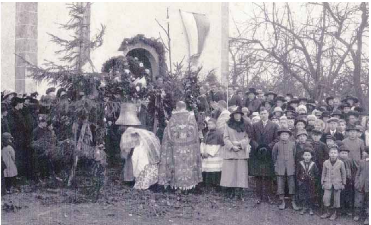
1925- Toute la communauté est présente pour la bénédiction de la cloche