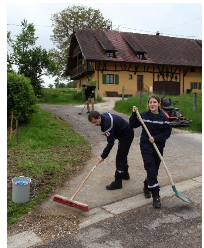
L'installation de l'hôtel à insectes, le grand nettoyage à la chapelle et les pompiers en pleine action !

Un grand merci à tous les participants de cette première édition et toutes nos excuses si vous n'apparaissez pas sur les photographies, il n'a pas été possible de tout publier. Nous vous donnons d'ores et déjà rendez-vous en mai 2016 pour la prochaine journée citoyenne.