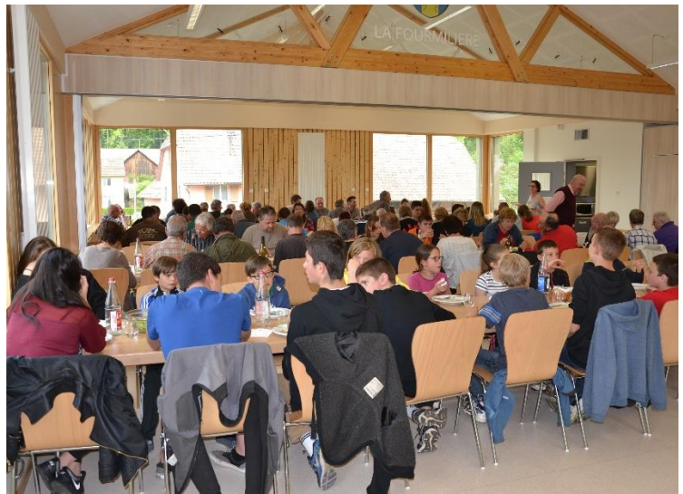
Un repas bien mérité !