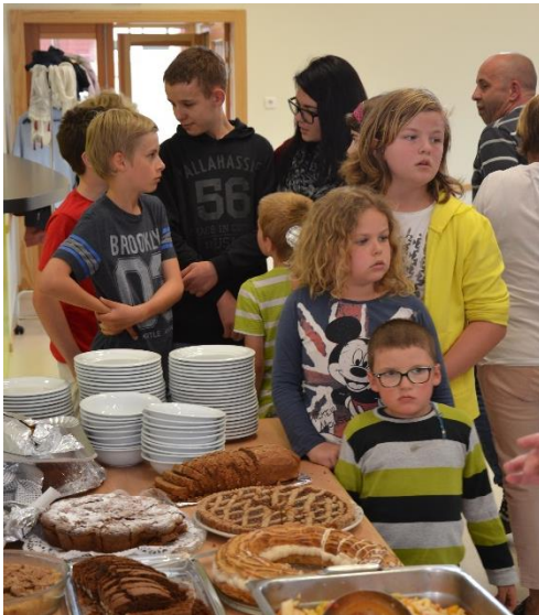
Des pâtisseries variées