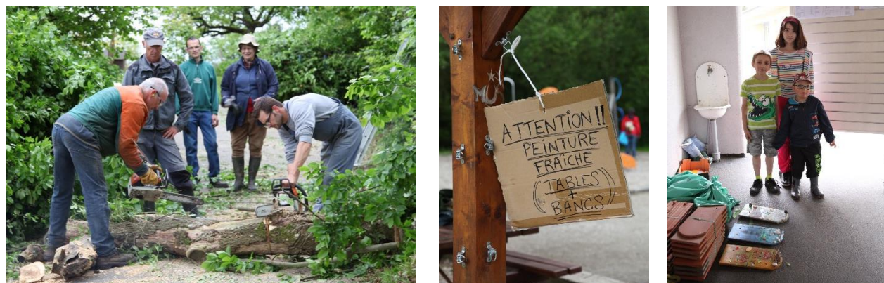
L'atelier élagage, les travaux au terrain de jeux et une partie des enfants encadrés par l'ASL