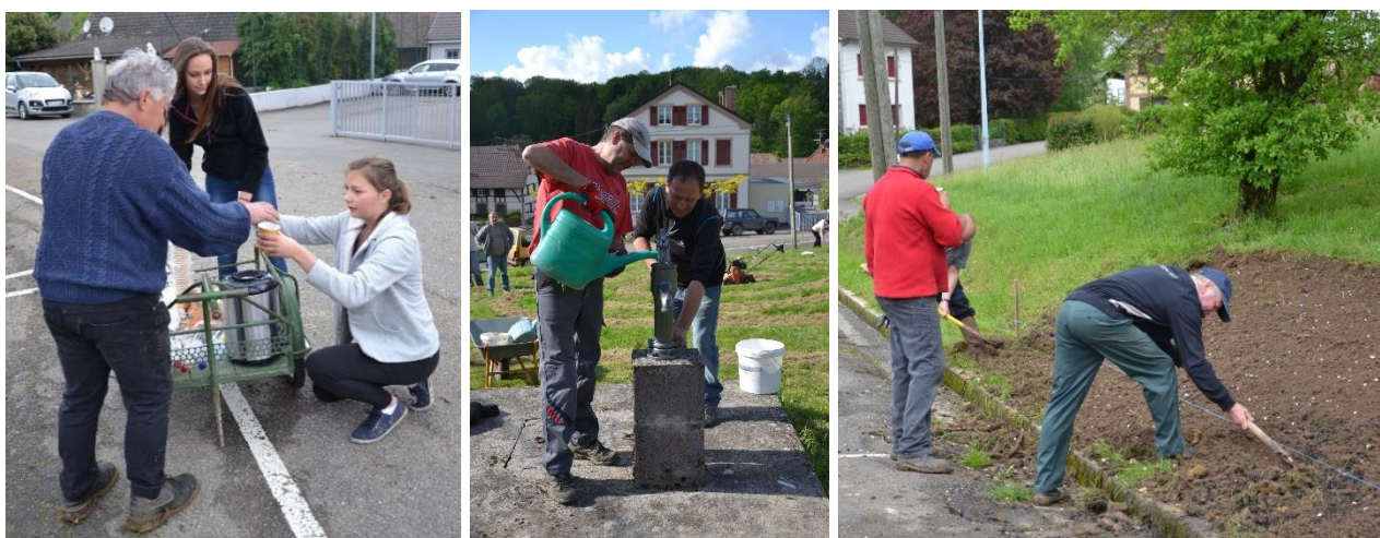
Le service ravitaillement, la remise en fonction de la fontaine et la préparation du terrain pour la jachère fleurie

Les habitants de Fulleren ont relevé le défi : le 9 mars dernier, à 8 heures précises, on se pressait devant la Fourmilière qui, cela a déjà été dit, n'a jamais si bien porté son nom. Après avoir pris quelques forces, tout ce petit monde s'est dirigé, en tenue de travail, avec matériel et entrain, vers les différents chantiers. Chacun, selon ses envies, mais aussi ses compétences, a apporté sa pierre à l'édifice. Le temps d'une journée, c'est un travail considérable qui a été accompli. Et la bonne humeur n'a jamais fait défaut. Nombreux étaient les participants qui, vers 19 heures, musardaient encore au centre du village, admirant le travail réalisé par les différents groupes, racontant les anecdotes de la journée ou faisant des propositions pour les futurs chantiers. Retour en images sur une journée pas comme les autres !