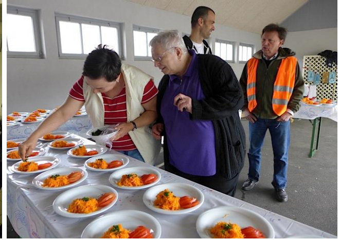
Une équipe de cuisine parfaitement synchronisée !